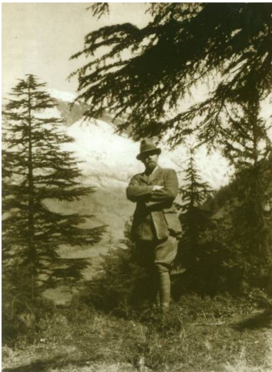
Юрий Николаевич Рерих в Кулу 1930-е гг.