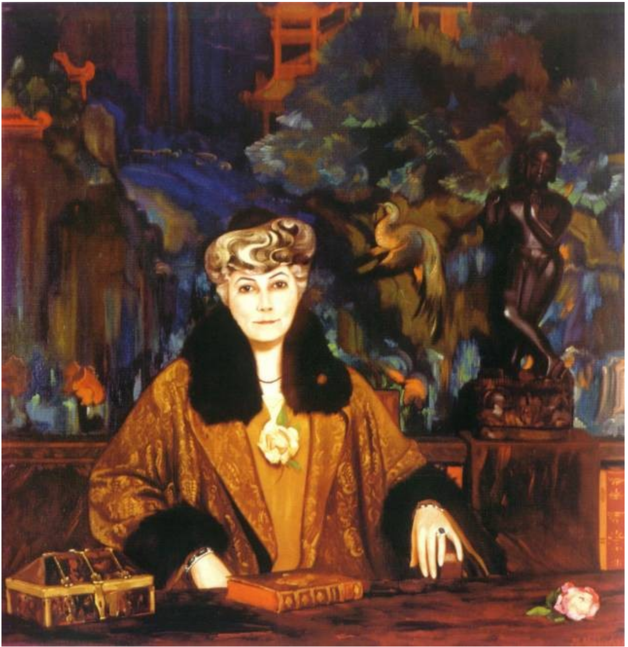
Елена Ивановна Рерих