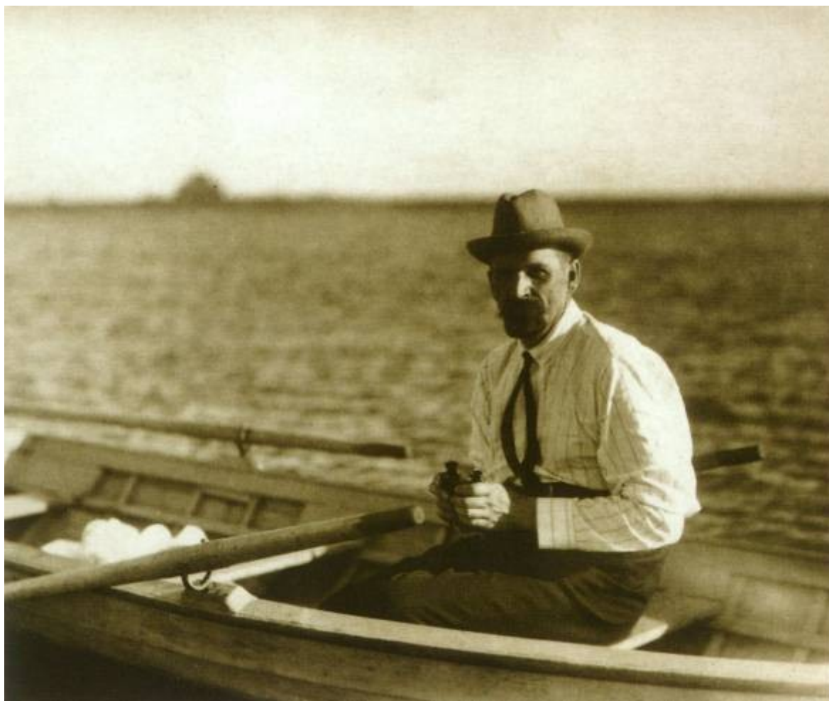
Владимир Константинович Рерих на реке Сунгари 1930-е гг.