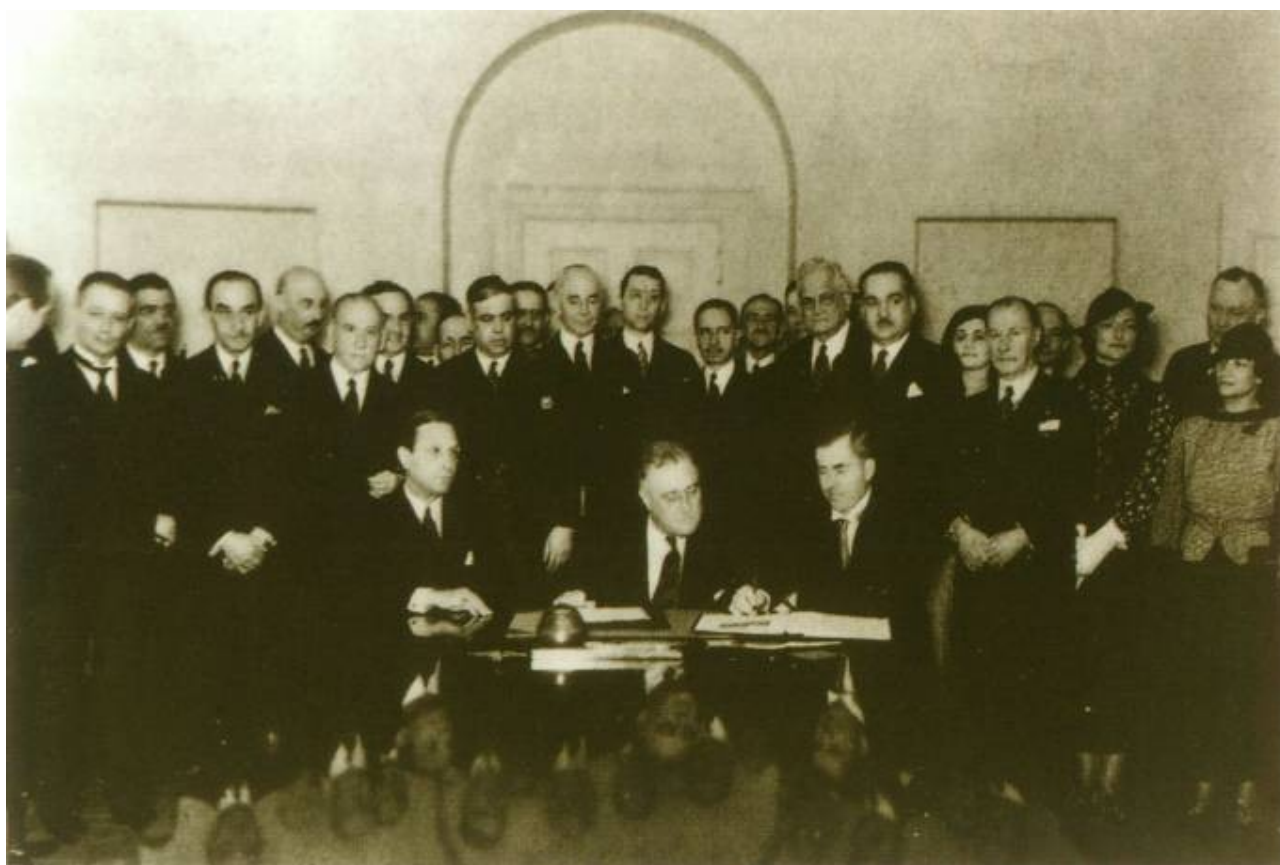
Подписание Пакта Рериха в Белом Доме (Вашингтон) Сидят: в центре – Ф.Д.Рузвельт, справа – Г.Э.Уоллес 15 апреля 1935 г.