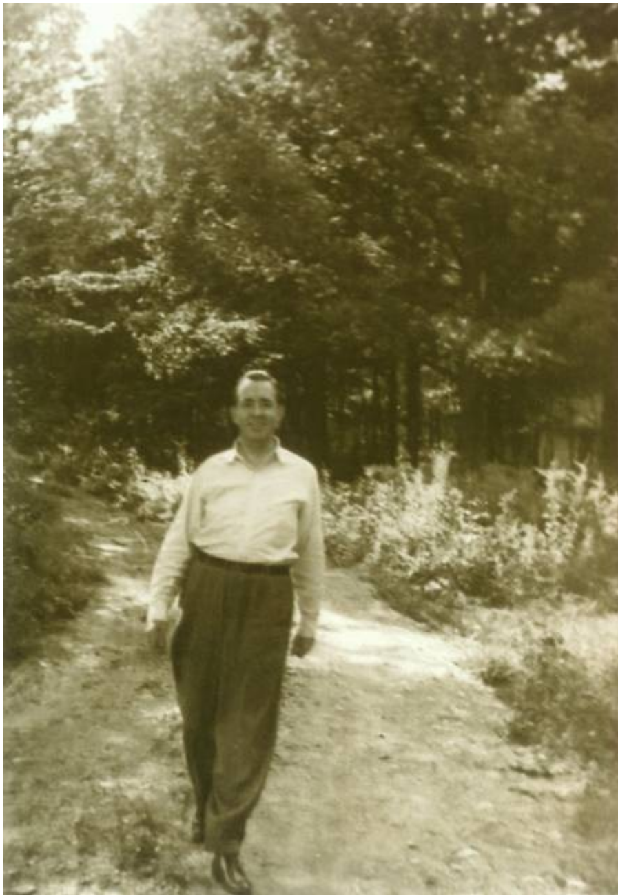
Дедлей Фосдик 1930-е гг.