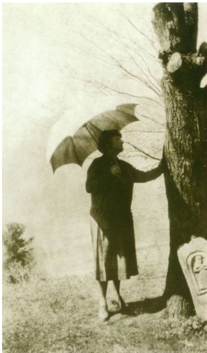
Елена Ивановна Рерих в Кулу 1930-е гг.