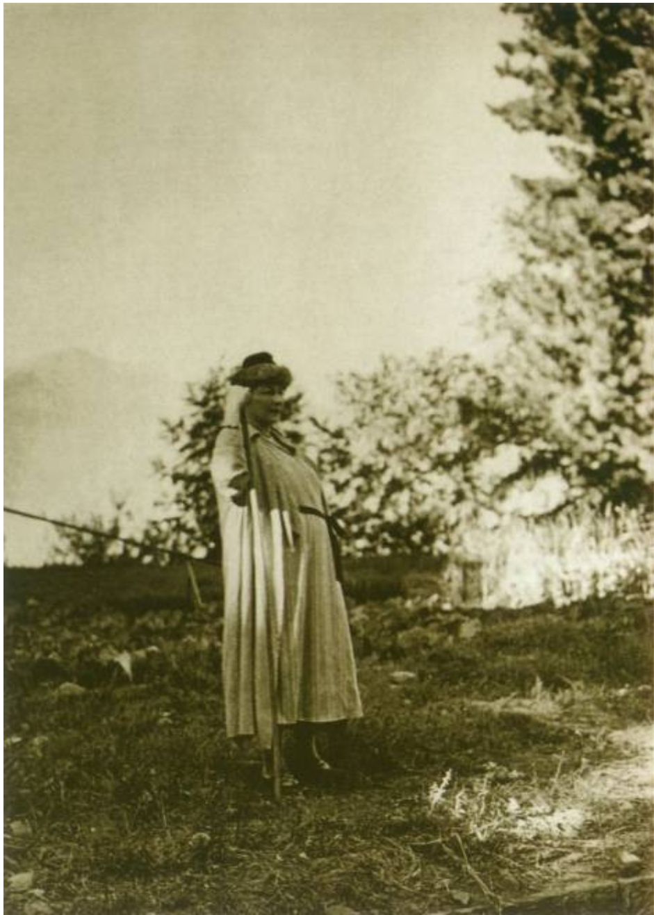
Елена Ивановна Рерих в Кулу 1930-е гг.