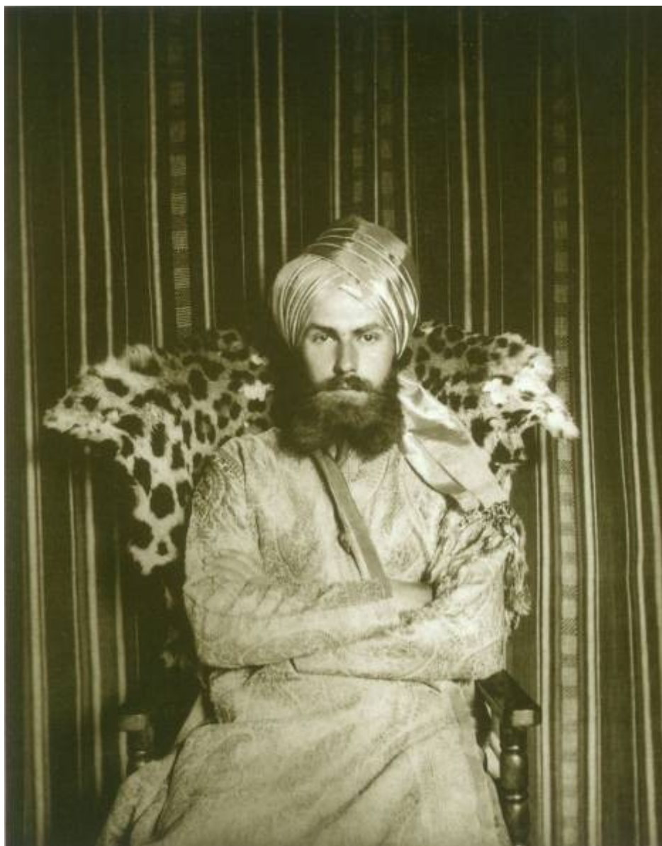
Святослав Николаевич Рерих в восточном костюме 1930-е гг.