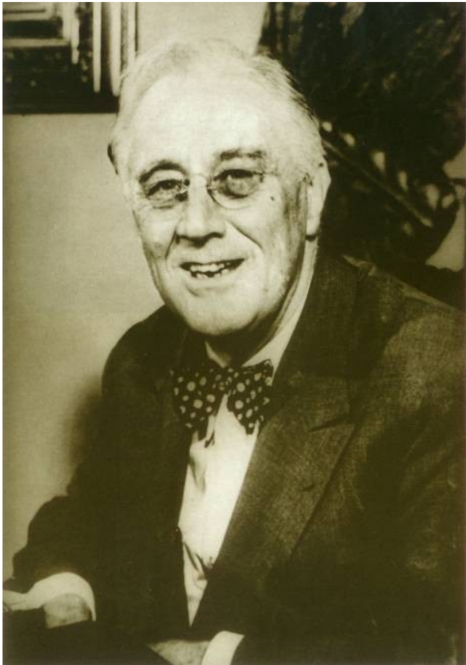
Президент США Франклин Делано Рузвельт 1940-е гг.