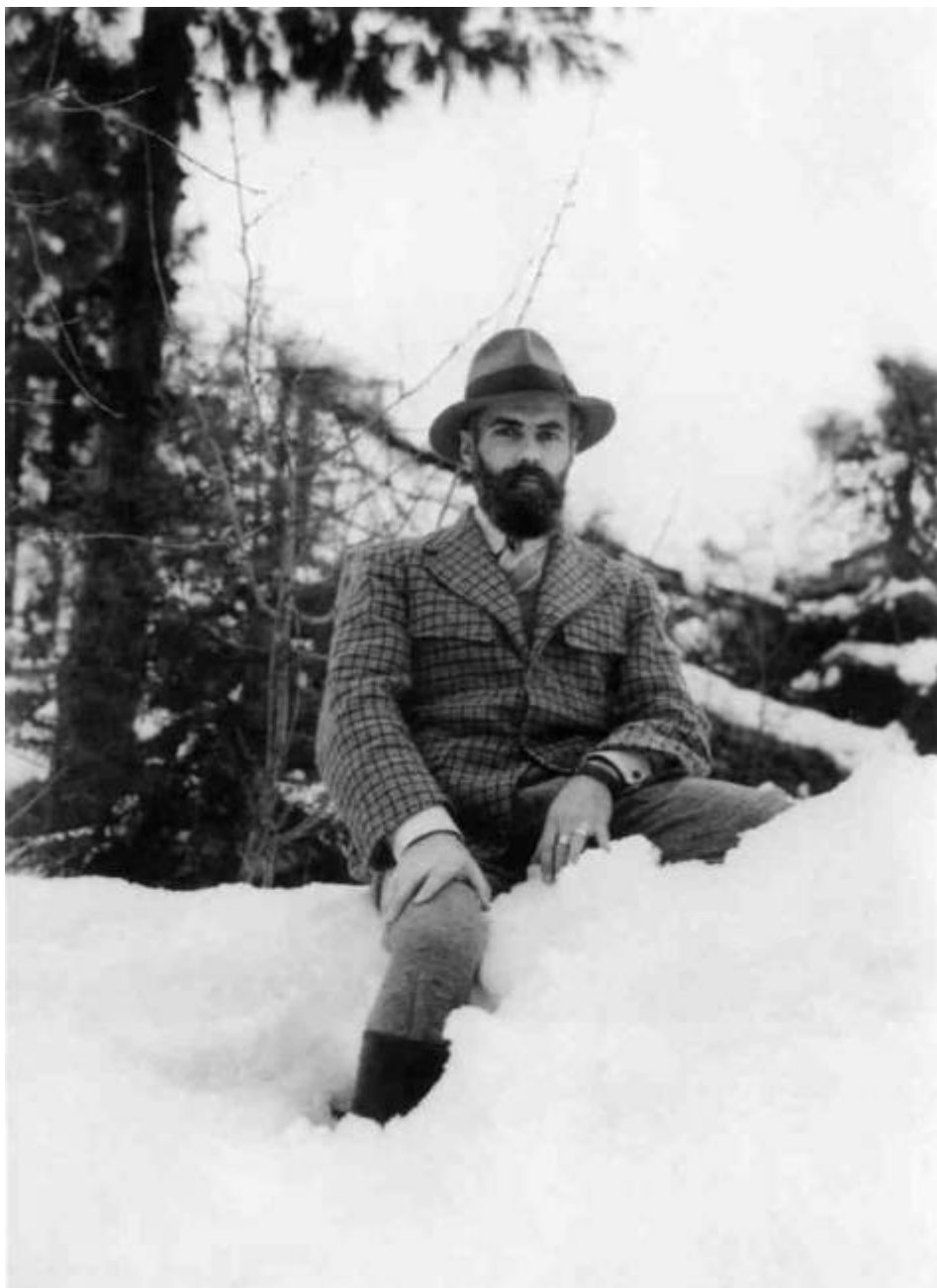
Святослав Николаевич Рерих в Кулу 1939