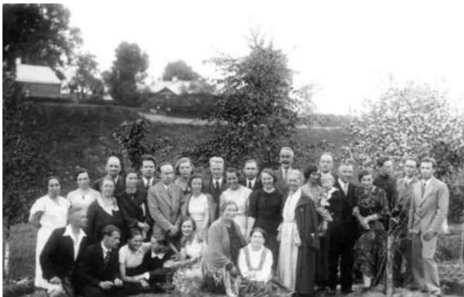
Члены Латвийского и Литовского обществ Рериха 1930-е гг.