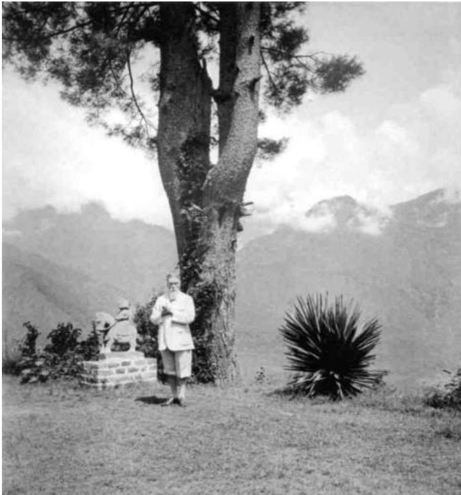
Николай Константинович Рерих в Кулу 1930-е гг.