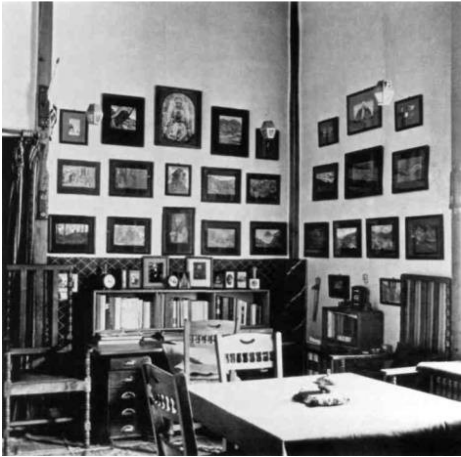
Интерьер одной из комнат дома Рерихов в Кулу