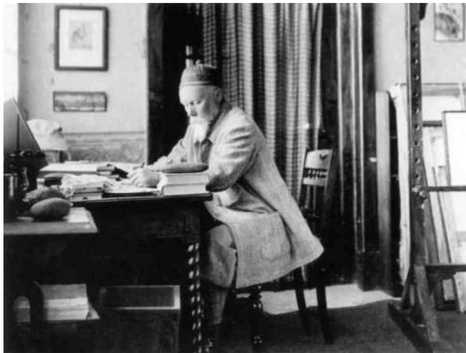
Николай Константинович Рерих в своем кабинете в Кулу 1930-е гг.