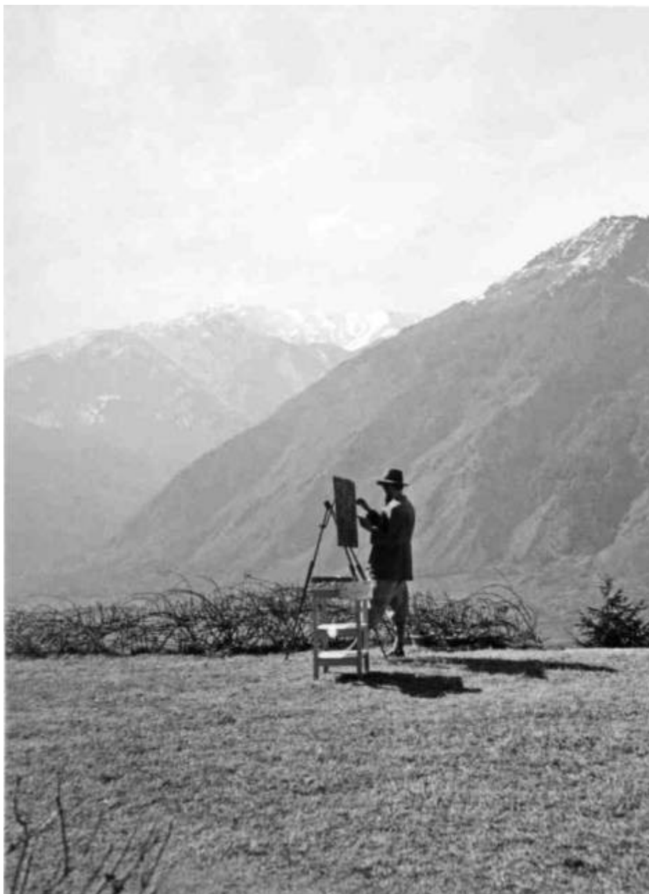
Святослав Николаевич Рерих в Кулу 1930-е гг.