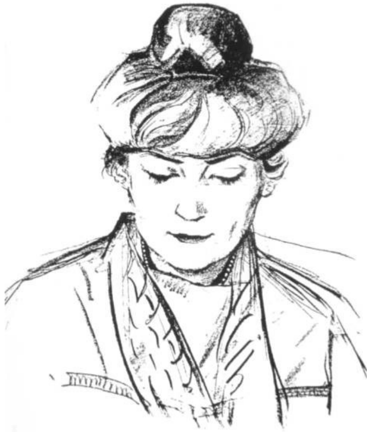
Елена Ивановна Рерих