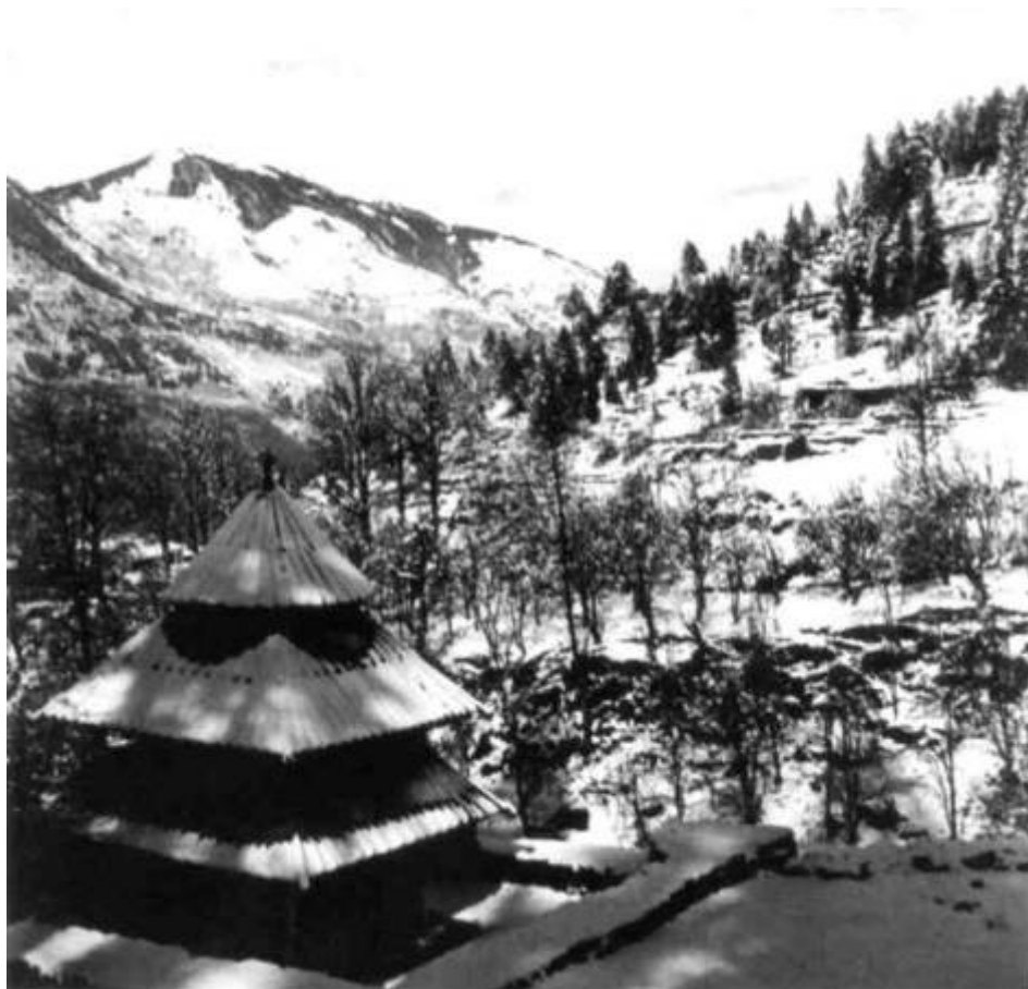
Храм Трипурасундарам. Наггар. Кулу