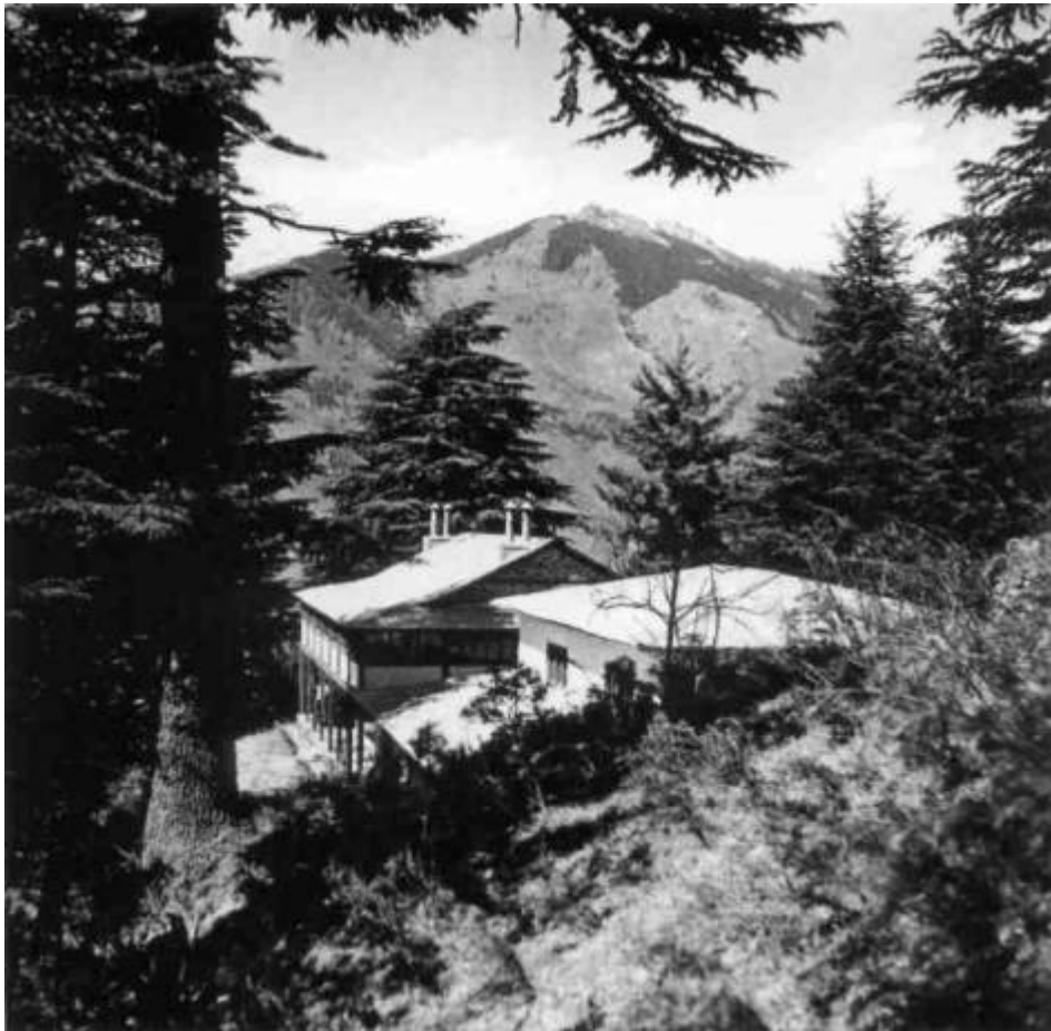
Институт Гималайских исследований «Урусвати»