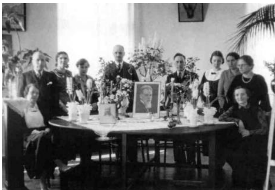
Члены Латвийского общества Рериха 1930-е гг.