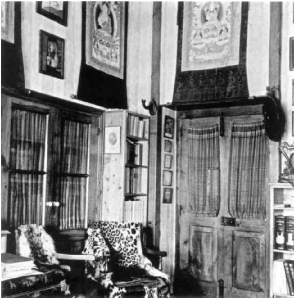
Интерьер одной из комнат дома Рерихов в Кулу