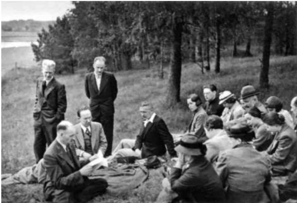
Члены Латвийского общества Рериха 1930-е гг.