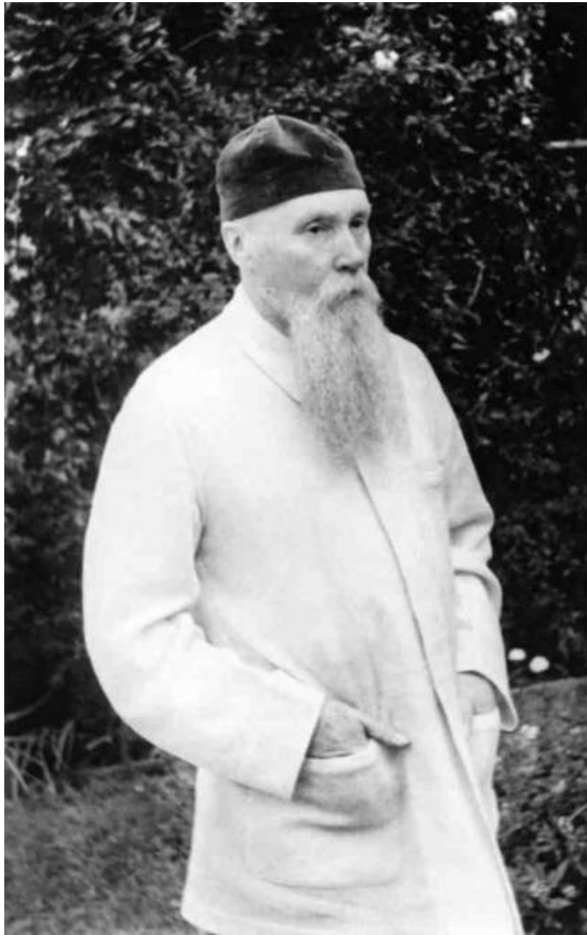
Николай Константинович Рерих 1930-е гг.