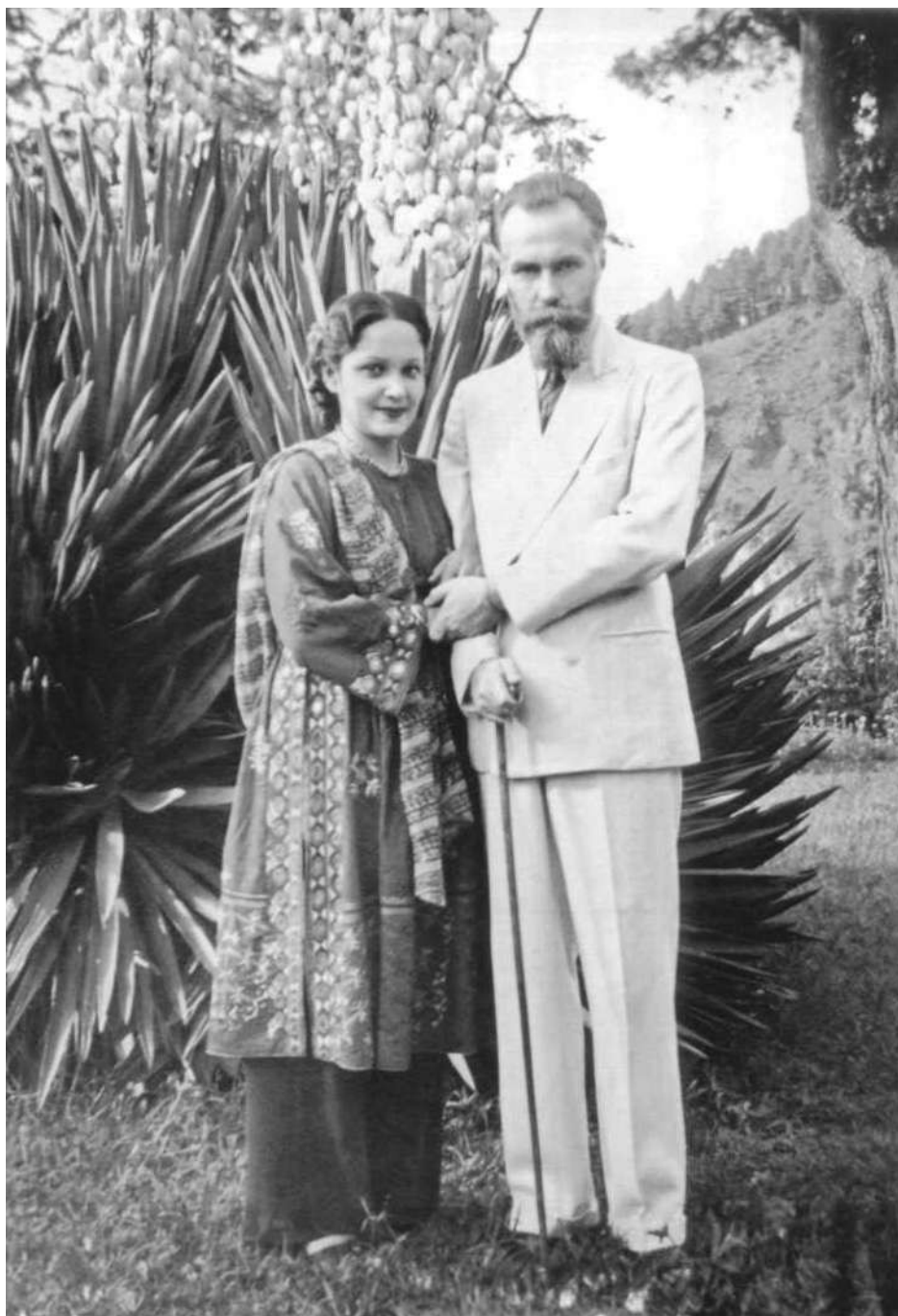
Девика Рани и Святослав Николаевич Рерихи [1945-1947). Кулу, Индия