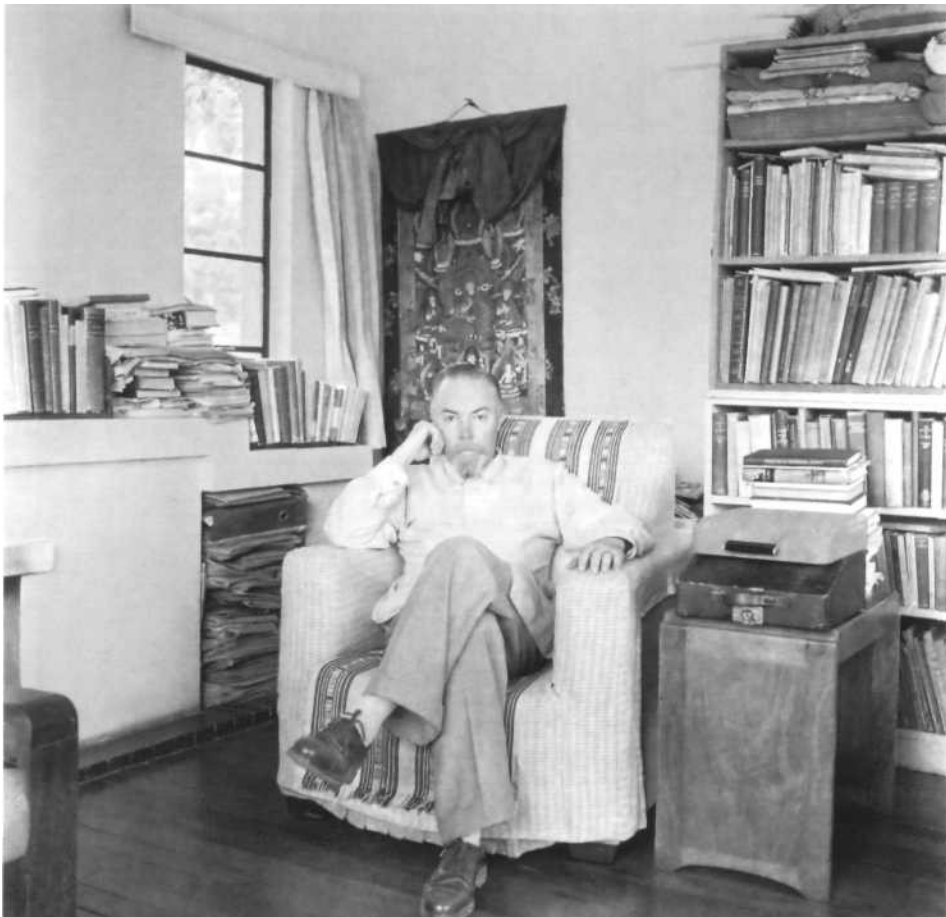
Юрий Николаевич Рерих 1949-1955. Калимпонг, Индия