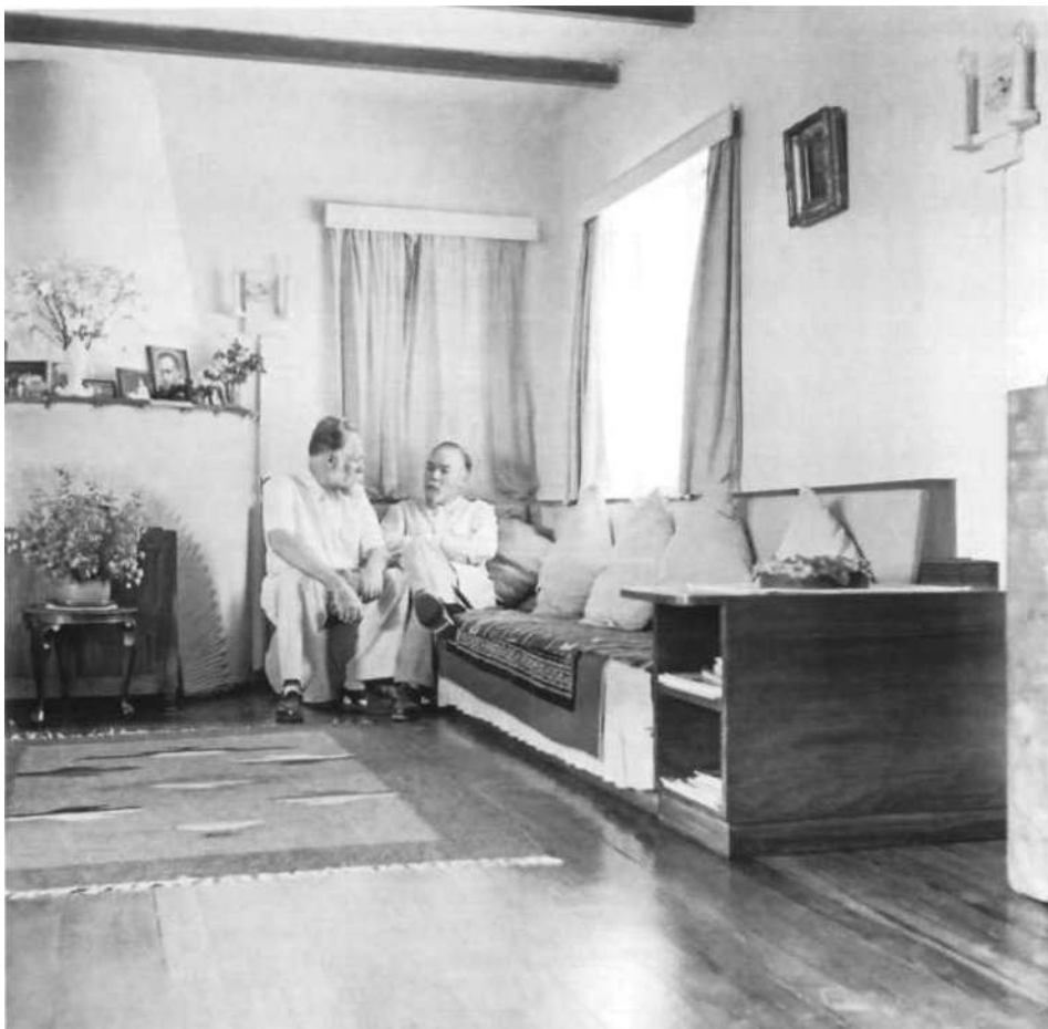
Юрии Николаевич и Святослав Николаевич Рерихи в Калимпонге 1949-1955