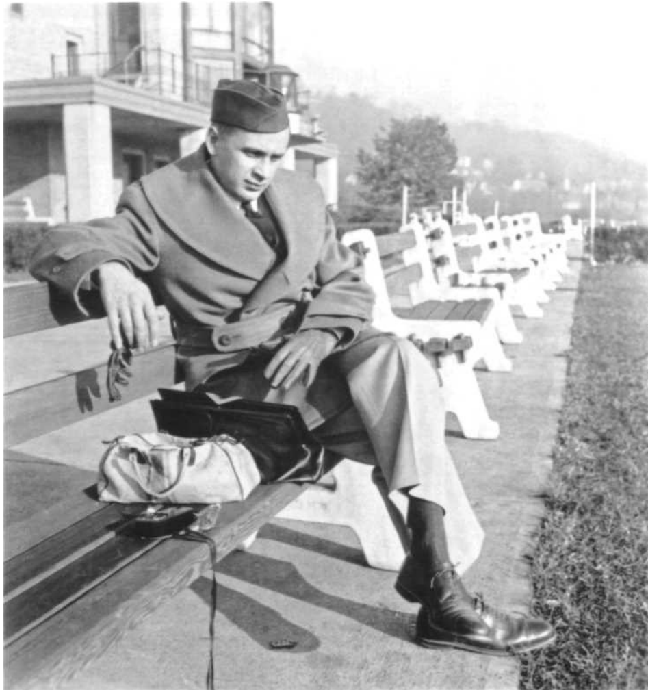
Дэвид Фогель 1943. США