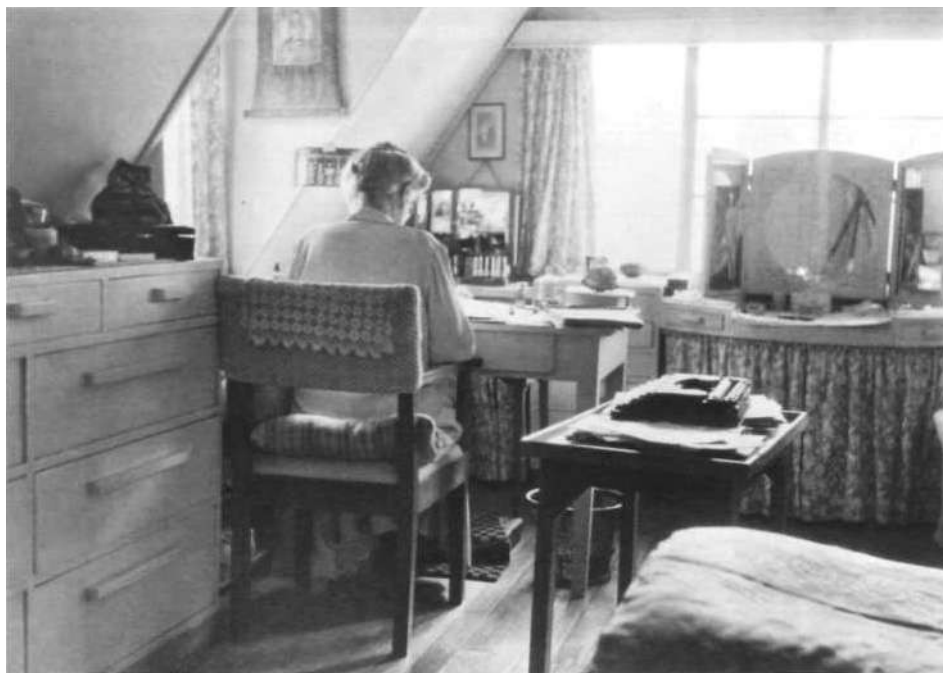
Елена Ивановна Рерих за рабочим столом 1949-1955. Калимпонг, Индия