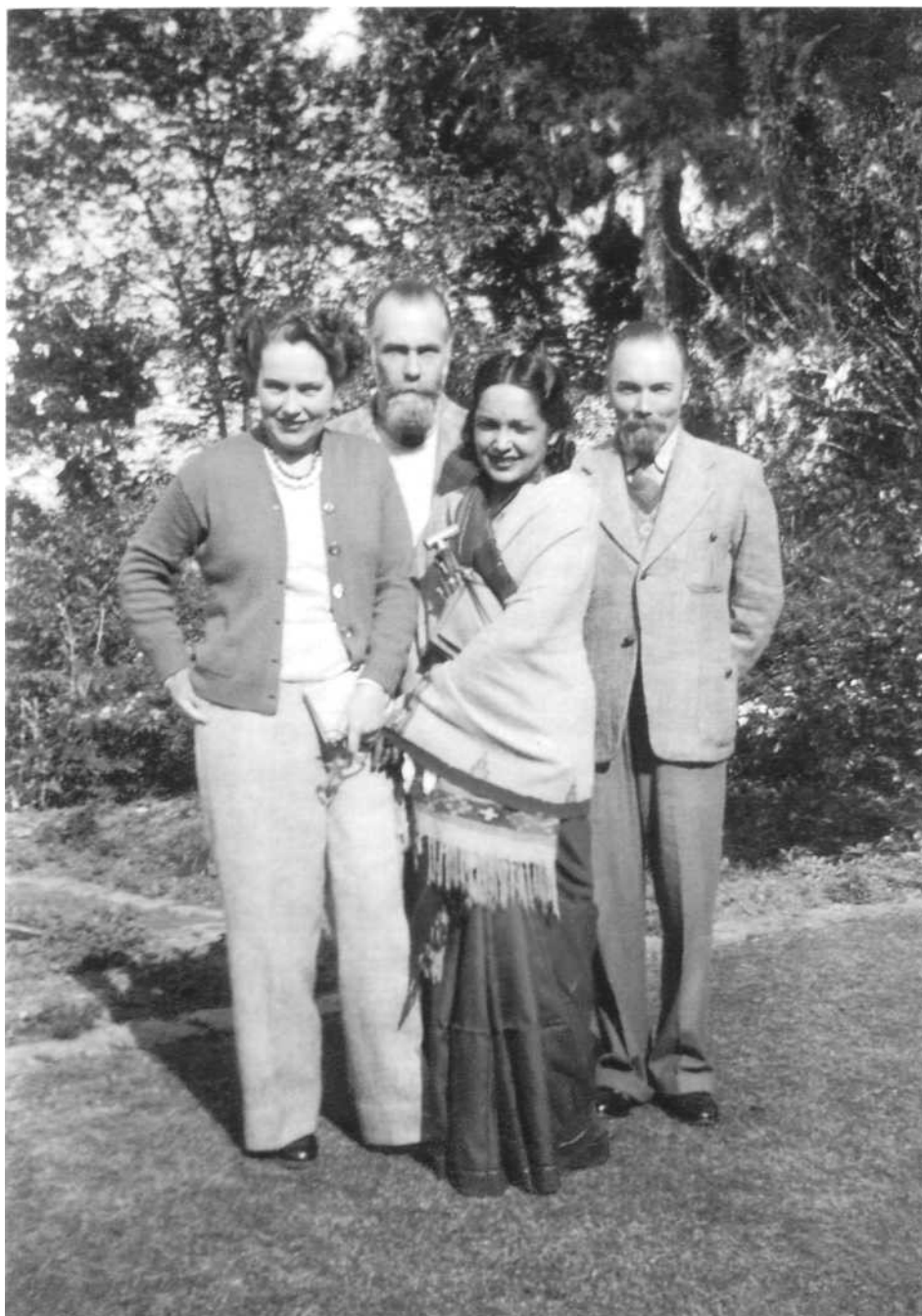
Слева направо: Кэтрин Кэмпбелл, Святослав Николаевич Рерих, Девика Рани Рерих и Юрий Николаевич Рерих [Декабрь 1949 г. – февраль 1950 г.] Калимпонг, Индия