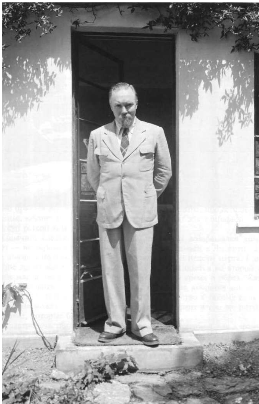
Юрий Николаевич Рерих перед входом в дом 1949-1955. Калимпонг, Индия